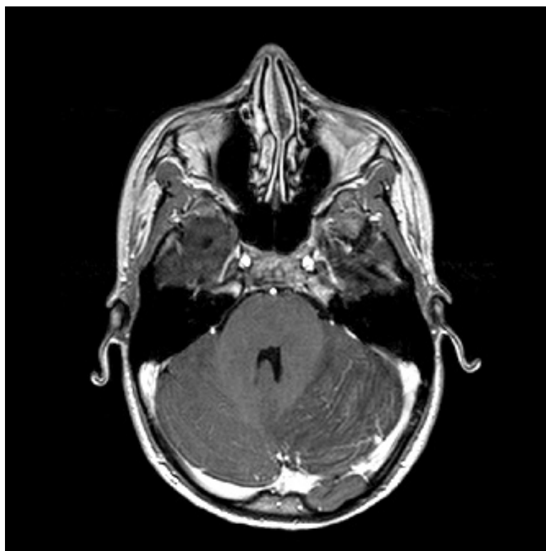
Figura 2. TRA SE T1 con contraste. Captación de contraste entre las folias