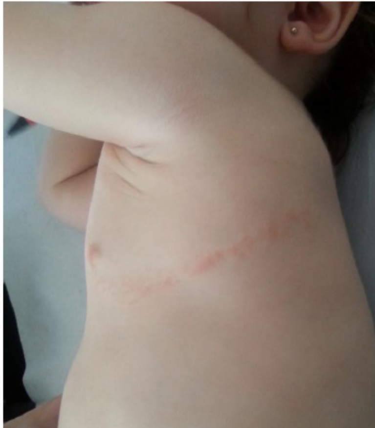
Figura 3. Lliquen estriado en región costal izquierda en fase papular eritematosa.

izquierda, siguiendo un trayecto lineal horizontal (Figura 3). No parecía presentar síntomas. En un primer momento se planteó el diagnóstico de herpes zóster, pero dado que la paciente tenía solo 6 meses, no había tenido varicela y no tenía vesículas ni las lesiones habían evolucionado, se descartó dicho diagnóstico y se planteó el de liquen estriado. Se explicó la benignidad del cuadro y se tranquilizó a los padres. En 4 meses desapareció, quedando la región hipopigmentada, que se resolvió por completo tras 8 meses. No precisó tratamiento.