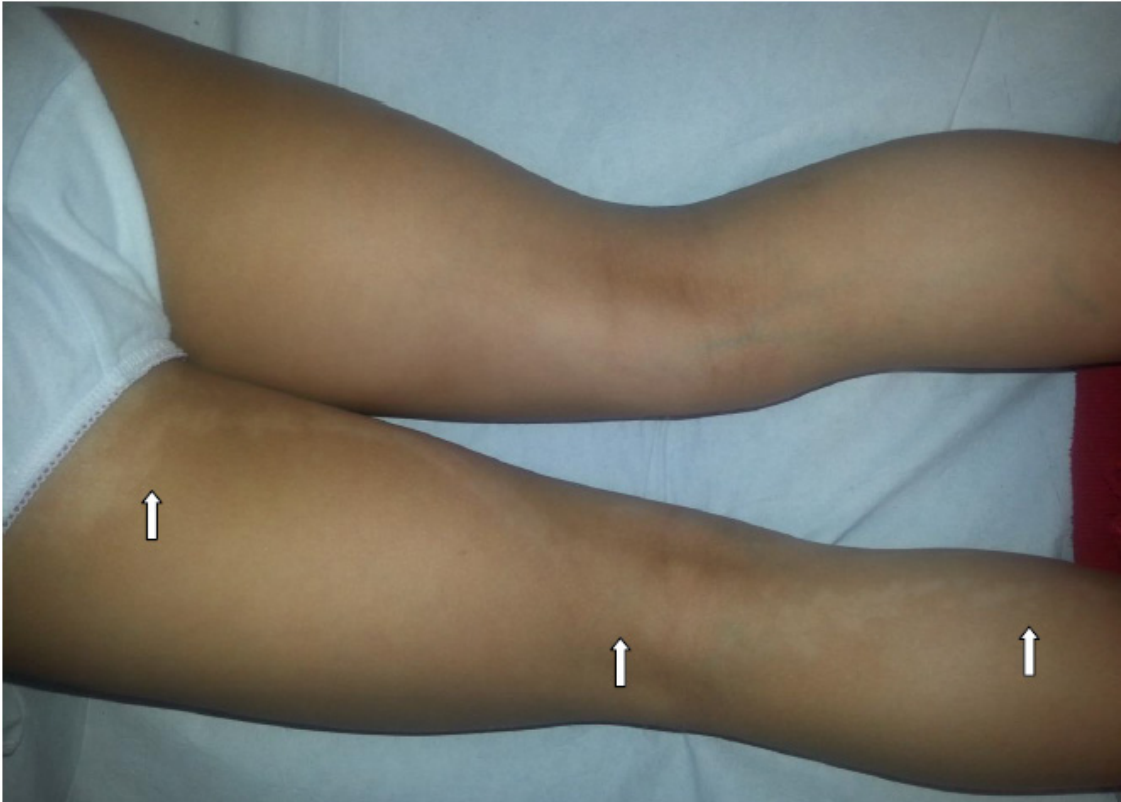
Figura 1. Lesión lineal hipopigmentada siguiendo una línea de Blaschko, desde el glúteo hasta el gemelo (flechas blancas).