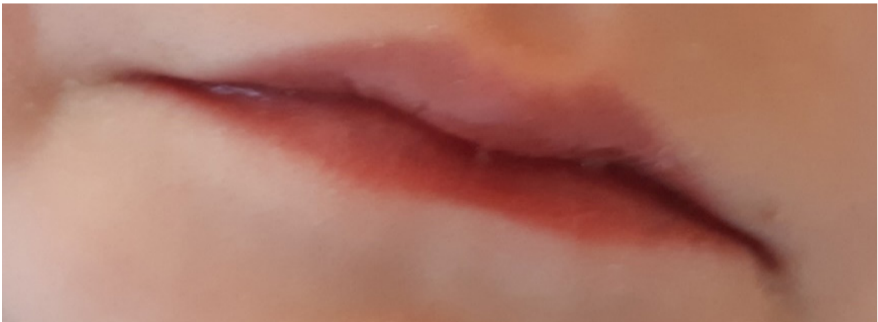
Figura 2. Rágades y fisuración bucal.

El paciente experimenta mejoría del estado general, resolución de los edemas y desaparición de la fiebre tras la instauración del tratamiento. Se comprueba el descenso de los RFA y la elevación plaquetaria. A nivel ecográfico se aprecia una disminución progresiva del calibre coronario, con resolución completa a los cuatro meses del diagnóstico.