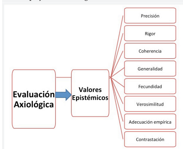
Figura 1. Evaluación axiológica de valores epistémicos en un proyecto de investigación.

La parte de la filosofía que estudia los valores se denomina axiología o estimativa. A los valores se le pueden atribuir las siguientes características: el hecho intrínseco de « valer », la objetividad, la no independencia, la polaridad, la cualidad y la jerarquía 9 .