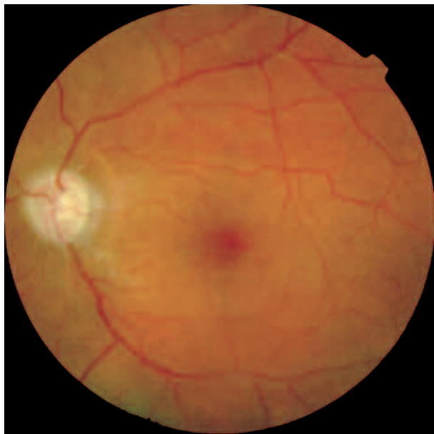
Fig. 2: Regresión espontánea de la retinopatía por descompresión (hemorragias retinianas, edema de papila y edema macular), 2 meses después de la cirugía de trabeculectomía.

En el caso presentado aparecen de forma conjunta todas las características descritas previamente, de