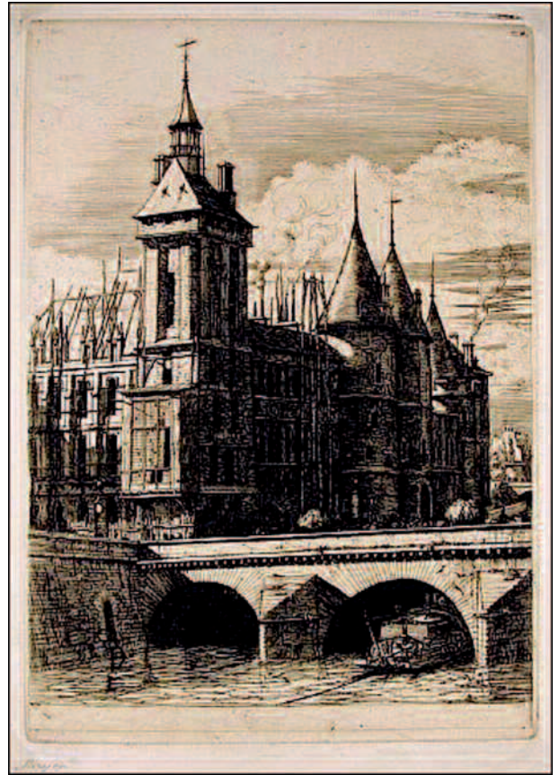
La torre del reloj, 1852.