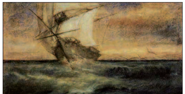
El barco fantasma en el Museo del Louvre.

Nunca ha existido un pintor importante con un defecto cromático y Meryon es el único que tiene un cuadro en un museo de primer orden como es el