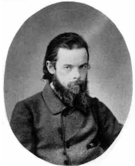
Charles Meryon, 1850.

Una de las raras pinturas que se conservan de Meryon (4) es la titulada El barco fantasma en el Museo del Louvre, realizada mediante la técnica de pastel y donde el artista evitó los verdes y rojos que