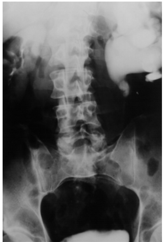
FIGURA 1. Urografía intravenosa: severa ureteropielocaliectasia izquierda secundaria a uropatía obstructiva incompleta por litiasis a nivel ureteral lumbar L3.

Se realizó Litotricia extracorpórea mediante Litotriptor Dornier Compact Delta previo posicionamiento de nefrostomía percutánea ecodirigida. En el control radiológico post-LEOC a la semana, se objetivó fragmentación y calle litiásica a nivel pelviano y lumbar alto (Fig. 3). Dada la eficacia fragmentadora se practicó una segunda sesión de LEOC permitiendo la reducción del volumen litiásico.