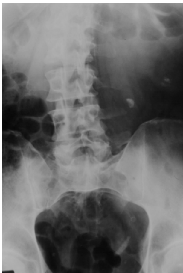
FIGURA 3. Fragmentación post-ESWL y calle litiásica ureteral pelviana de la porción cristalina del cálculo, con persistencia litiásica lumbar alta.

segmentaria del uréter lumbar con ureteropieloplastia desmembrada sobre catéter ureteral doble J, así como extracción de los fragmentos residuales alojados en cáliz inferior. El postoperatorio transcurrió sin incidencias retirando el tutor ureteral a las 6 semanas. El resultado histológico reportó la presencia de una formación calcúscula pardo-oscura de 1 cm de diámetro íntimamente adherida a la mucosa sobre área excavada en la pared ureteral. La unión pieloureteral presentaba un foco de ulceración con acumulo de material cristalóide y reacción gigantocelular a cuerpo extraño, así como áreas de metaplasia escamosa. El cálculo presentaba una zona central de tejido óseo con trabéculas gruesas y espacios medulares con abundantes vasos y fibrosis irregular compatible con litiasis ósea (Figs. 4 y 5).