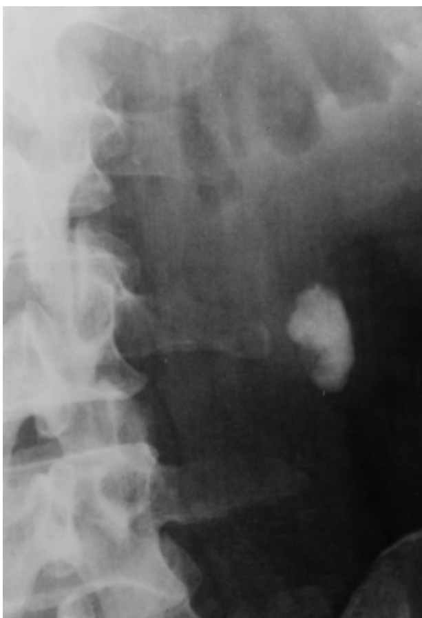
FIGURA 2. Rx simple aparato urinario: cálculo ureteral lumbar alto, de 2 x 1,5 cm, de densidad inhomogénea y área hipodensa excéntrica periférica medial.

sico y la posterior expulsión de los cálculos fragmentados tras oclusión de la nefrostomía. En pielografía anterógrada, se confirmó la permeabilidad de la vía urinaria y la extraordinaria firmeza del fragmento residual a la pared urotelial. La creatinina plasmática se normalizó en cifras de 1,13 mg/dl tras el episodio obstructivo agudo. Los fragmentos expulsados y analizados presentaron una composición mixta de oxalato cálcico monohidrato y fosfato cálcico. Animados por los resultados, realizamos una tercera sesión de litotricia extracorpórea que resultó completamente infructuosa.