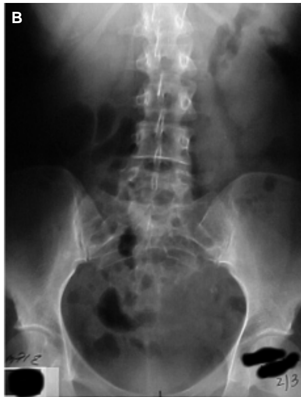
FIGURA 3. A: Litiasis uréter lumbar izquierdo. B: Litiasis tras LEOC. C: UIV que muestra la extrusión litiásica.