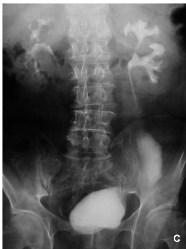
FIGURA 1. A: Litiasis uréter lumbar izquierdo. B: Extravasado tras URS. C: Reconstrucción ureteral con vejiga