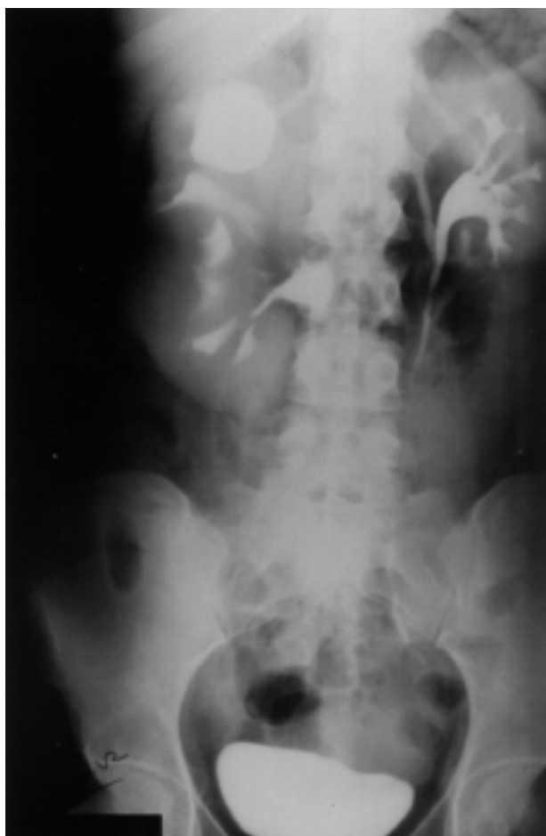
FIGURA 2. Urografía intravenosa. Masa renal polar superior derecha quística que produce desplazamiento y ectasia de los cálices renales superiores.

pseudocápsula fibrosa de aspecto sarcomatoso, sin invasión de la cápsula ni de la vena renal. Sin embargo, el patólogo refleja la afectación tumoral en el cono de entrada de la arteria renal por la presencia de masa tumoral necrosada en su interior, comprobándose la existencia en la pared de dicha arteria, de múltiples placas de ateroma y de fibras elásticas. Microscópicamente, el tumor presentaba una proliferación neoplásica monofásica de células de estirpe blastomatosa pequeñas e hiper cromáticas, en nidos sólidos con crecimiento en sábana y estructuras acinares y tubulares (Fig. 4).