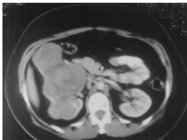
FIGURA 3. TAC. Masa renal derecha sólida de 10 cm de diámetro mayor.

Posteriormente la paciente fue remitida al Servicio de Oncología, donde recibió quimioterapia