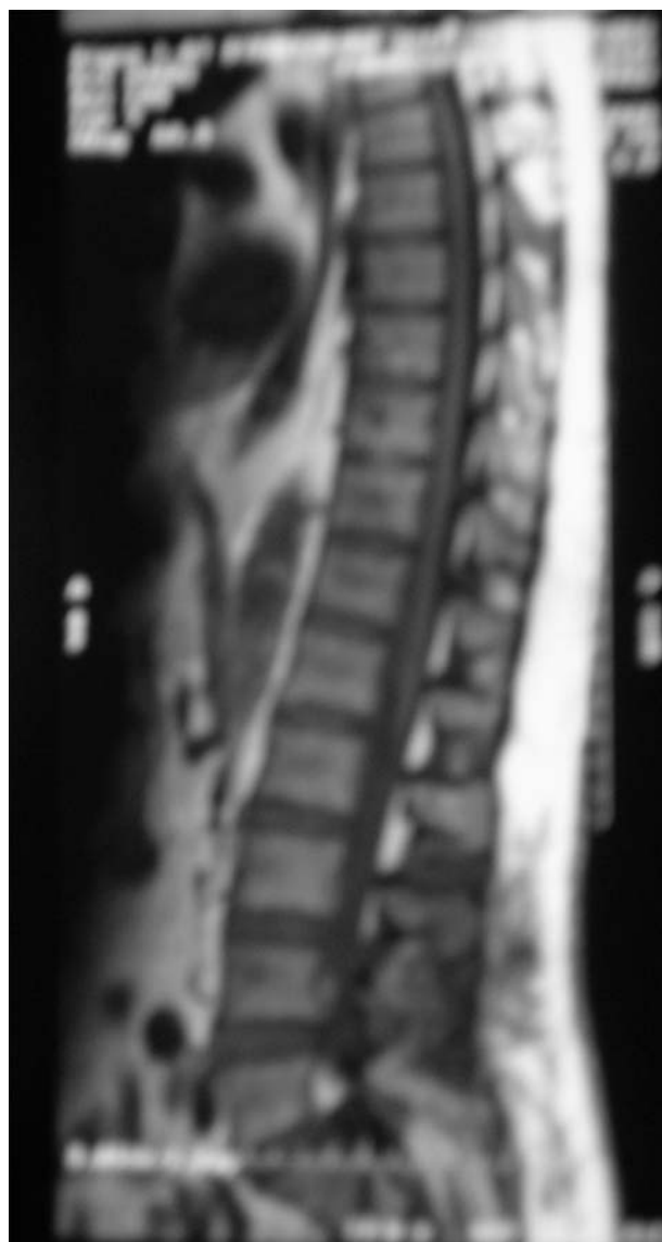
FIGURA 3: Imagen de RMN lumbar compatible con empiema subdural.

El absceso prostático es una entidad clínica poco frecuente. La incidencia entre los pacientes con sintomatología del tracto urinario inferior oscila entre 0,5-2,5% 1,7 .