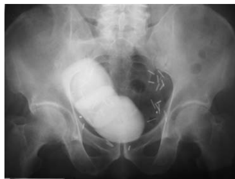
FIGURA 2. Radiografía simple de abdomen: litiasis de gran tamaño en pelvis.