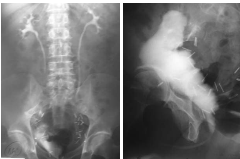
FIGURA 1. UIV y cistografía de neovejiga ileal hace 15 años.

Correspondencia autor: Dr. R. Ruiz Mondéjar. Servicio de Urología. Complejo Hospitalario Universitario de Albacete. Hermanos Falcó, 36 - 02006 Albacete Tel.: 967 597 235 E-mail: ruizmondejar@ono.com Información artículo: Imágenes en Urología Trabajo recibido: junio 2006 Trabajo aceptado: agosto 2006