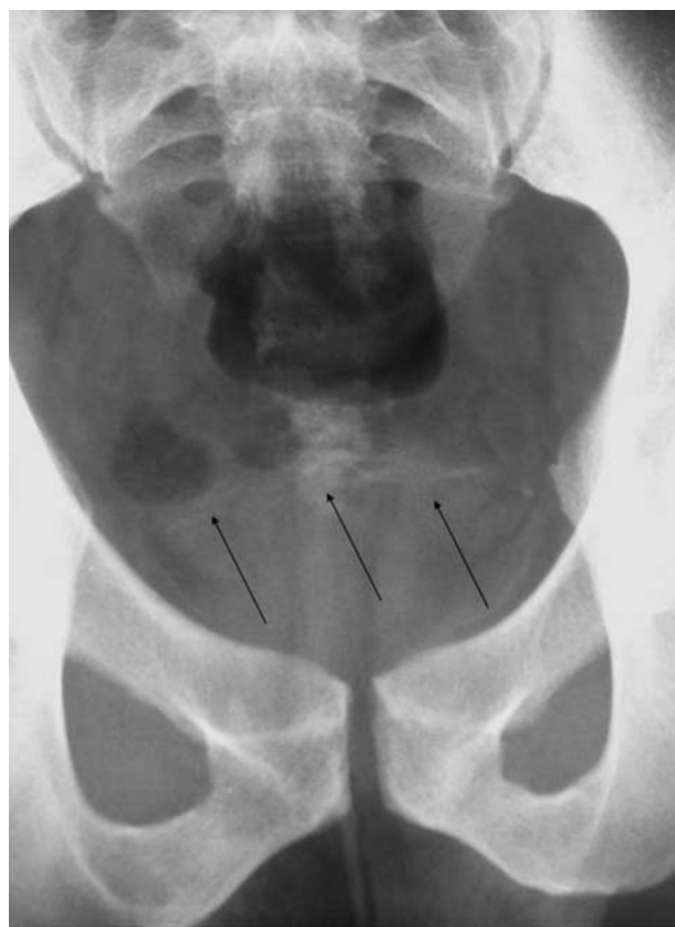
FIGURA 1. Imágenes de calcificaciones vesicales lineales en radiografía simple de abdomen.

El paciente se trató con Praziquantel en dosis única 40 mg/kg de peso en monodosis. Evoluciona favorablemente 3 meses después y sigue revisiones ambulatorias.