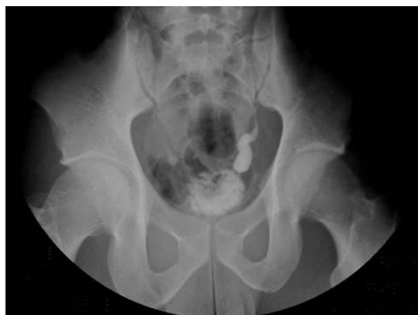
FIGURA 2. Imagen de urografía intravenosa en la que se observa estenosis ureteral distal izquierda.