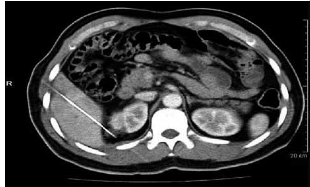
FIGURA 3. Abordaje transhepático de lesión renal derecha.