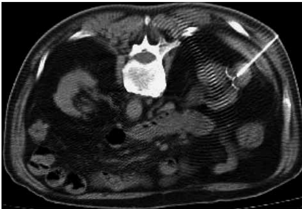
FIGURA 2. Localización vía fluroscopia de lesión renal izquierda.

cuencia (cinco lesiones renales) bajo guía fluoroscópica en 4 pacientes. El tiempo promedio de cada procedimiento fue de 45 +/- 15 minutos.