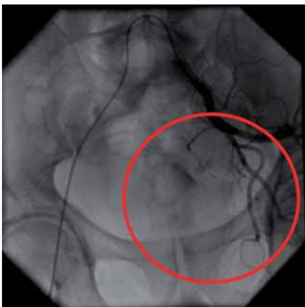
FIGURA 2. Imagen posterior a embolización

taron remisión de la hematuria a las 48 horas. 2 pacientes presentaron recidiva del sangrado durante la primera semana posterior al procedimiento, por lo que requirieron reintervención: un paciente fue sometido a una nueva embolización supraselectiva de arterias vesicales con material microparticulado, y al otro paciente se le instaló un coil de 4mm en la rama anterior de la arteria iliaca interna