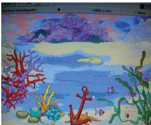
FIGURA 4. Pantalla de monitor para BFB con escena (Medicina y Mercado™).