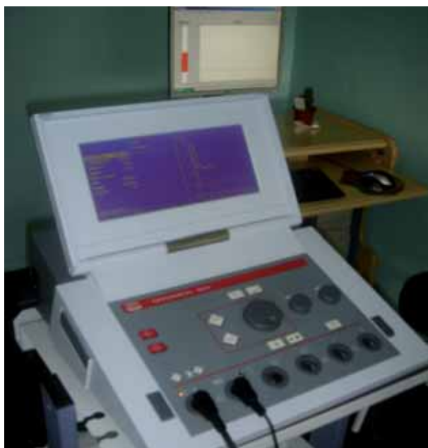
FIGURA 3. Pantalla de monitor para BFB sin escena (Enraf Nonus™).