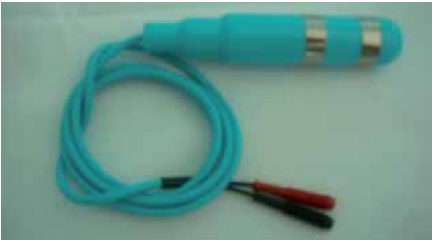
FIGURA 6. Electrodo para electroestimulación vaginal.