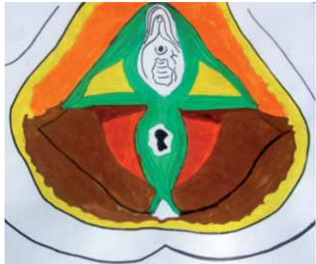
FIGURA 1. Músculos del suelo pélvico.

La actual teoría integral de la IU explica que la laxitud de la vagina y de los ligamentos de apoyo, altera el reflejo de la tensión mantenida, lo que impide una correcta distensibilidad para la función de almacenamiento (IIU) y una correcta plasticidad y tensión para mantener la continencia con la correcta transmisión de presiones, así como también dificulta la embudización y morfología de las estructuras para la micción y la continencia respectivamente (IUE) 7 .