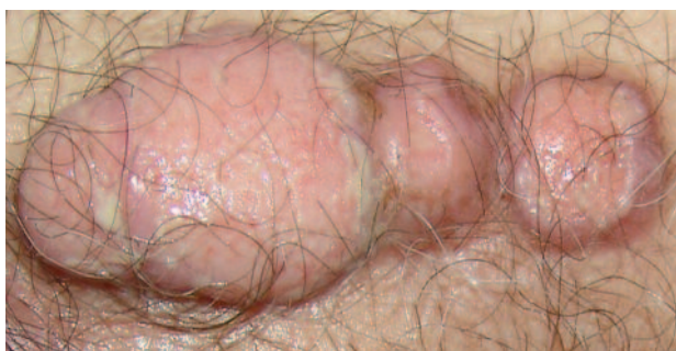
FIGURA 5. Visión a mayor aumento de las lesiones nodulares.

La biopsia de una de estas lesiones fue positiva para carcinoma escamoso.