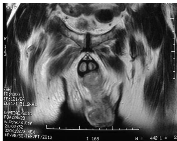
FIGURA 3. RNM pelvis. Corte coronal que muestra colección entre uretra peneana y cuerpos cavernosos rodeada de tejido mamelonado que capta contraste.