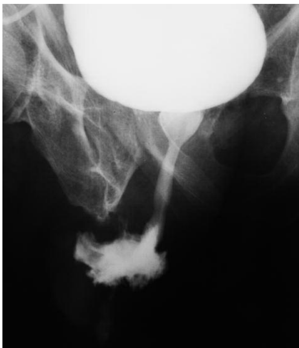
FIGURA 1. Extravasado de contraste a nivel de uretra peneana proximal, con mínima representación de uretra distal en placas miccionales.

Tras presentar mejoría clínica y analítica, se realizó ecografía abdominal que mostró seroma subcutáncial a nivel inguinal derecho y cistografía por sonda de cistostomía donde se observó un extravasado en uretra peneana proximal (Fig.1).