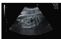
Figura 1 – Imagen de la ecografía prenatal en la que se observa la silueta renal de grandes dimensiones; en la parte más caudal se observa el aspecto hiperecogénico del seno renal rodeado de parénquima normal, y en la parte más superior se observa imagen anecoica compatible con ectasia rodeada de parénquima.

J. Navarro Gil a,* , J.A. López López a , R. González de Agüero b , J.M. Sánchez Zalabardo a y J. Valdivia Uría a