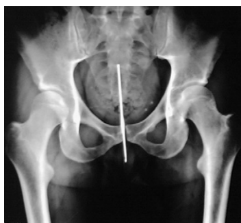
Figura 1 – Cuerpo extraño (aguja de crochet) en la uretra.