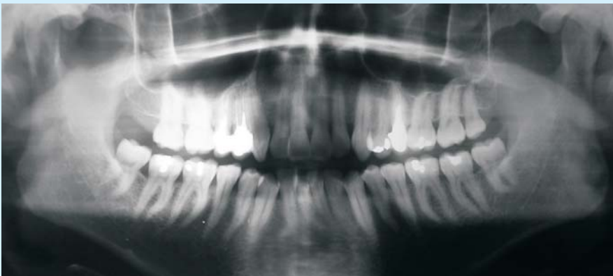
Figura 2. Ortopantomografía del individuo problema para poner de manifiesto las restauraciones a emular en el material cadavérico.