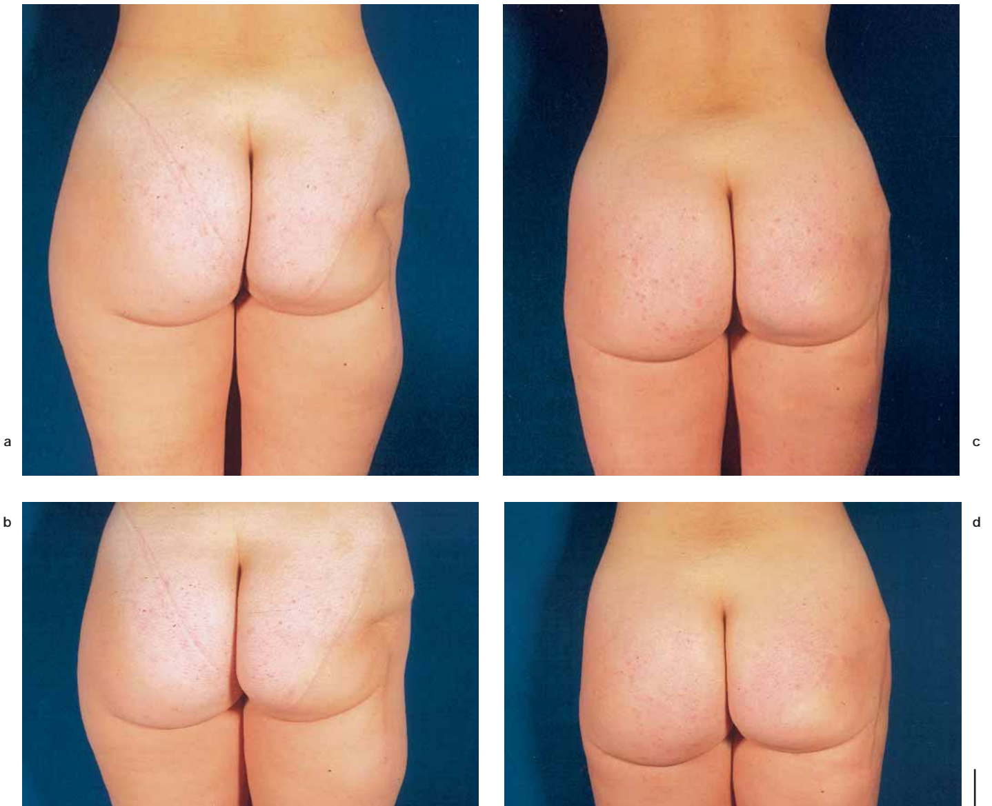
Figura 6. (a, b) Paciente de 25 años con pérdida de sustancia en muslo secundaria a atropello de camión. (c,d): corrección en 3 tiempos (270cc, 150cc y 50cc) mediante lipoestructura a los 5 años de postoperatorio.