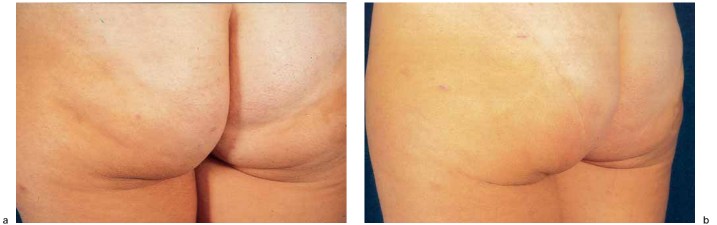
Figura 5. (a) Paciente de 26 años con depresiones glúteas. (b): relleno en una única sesión de lipoestructura, acompañada de liposucción trocantérea, con una evolución de 7 años.