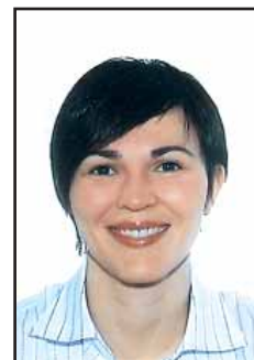
Pérez de la Fuente, T.

Pérez de la Fuente, T.*, González González, I.*