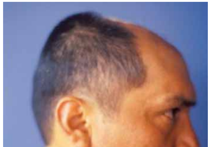
Fig. 2. Imagen lateral preoperatoria del defecto biparietal.