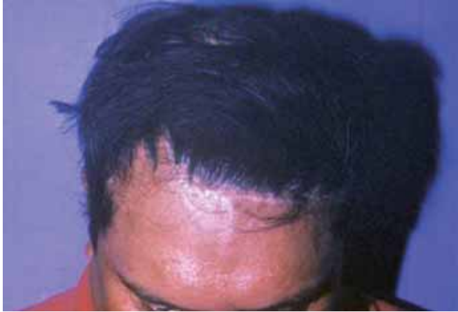
Fig. 6. Imagen postoperatoria a las 6 semanas de la intervención: se aprecia la cobertura adecuada del defecto biparietal.