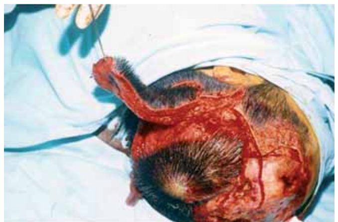
Fig. 5. Segundo tiempo quirúrgico: levantamiento del colgajo prefabricado del área occipital de la piel cabelluda con disección de su pedículo.

de exposición ósea en su totalidad y las áreas donadoras presentaron integración completa del injerto, sin complicaciones (Fig. 6-8).