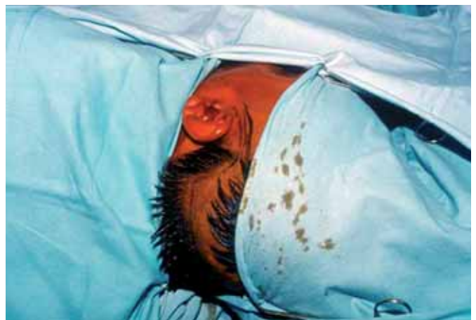
Fig. 4. Imagen intraoperatoria de la zona donde se implantará en un plano subcutáneo el colgajo radial dermofacial, con anastomosis a los vasos temporales.