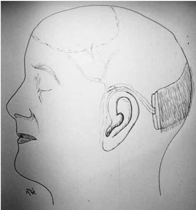
Esquema 1: Dibujo que muestra el diseño del colgajo occipital prefabricado anastomosado a los vasos temporales superficiales.