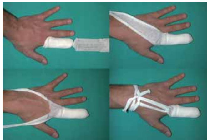
Fig. 2. Imágenes durante las distintas fases del procedimiento: Arriba izquierda: Primera fase con el aplicador puesto desde el inicio. Arriba derecha: Después de la retirada del aplicador, con una porción en exceso de vendaje para la fijación. Abajo izquierda: Sección longitudinal del vendaje, cortado en dos, para fijación. Abajo derecha: Vendaje realizado, completo y fijado.