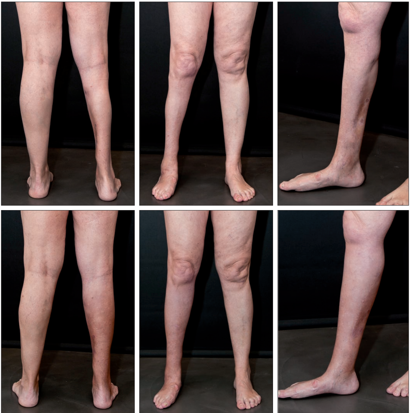
Fig. 2. Caso 2. Imágenes preoperatorias (fila superior) y postoperatorias (fila inferior) 12 meses después de la segunda sesión.

Durante la primera sesión injertamos 26 cc de tejido adiposo, seguidos de 40 cc más a los 8 meses y de 50 cc más