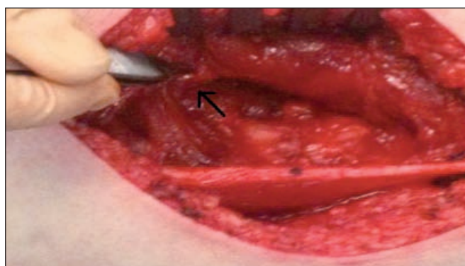
Fig. 2. Nervio ciático (flecha) después de extirpar la tumoración.