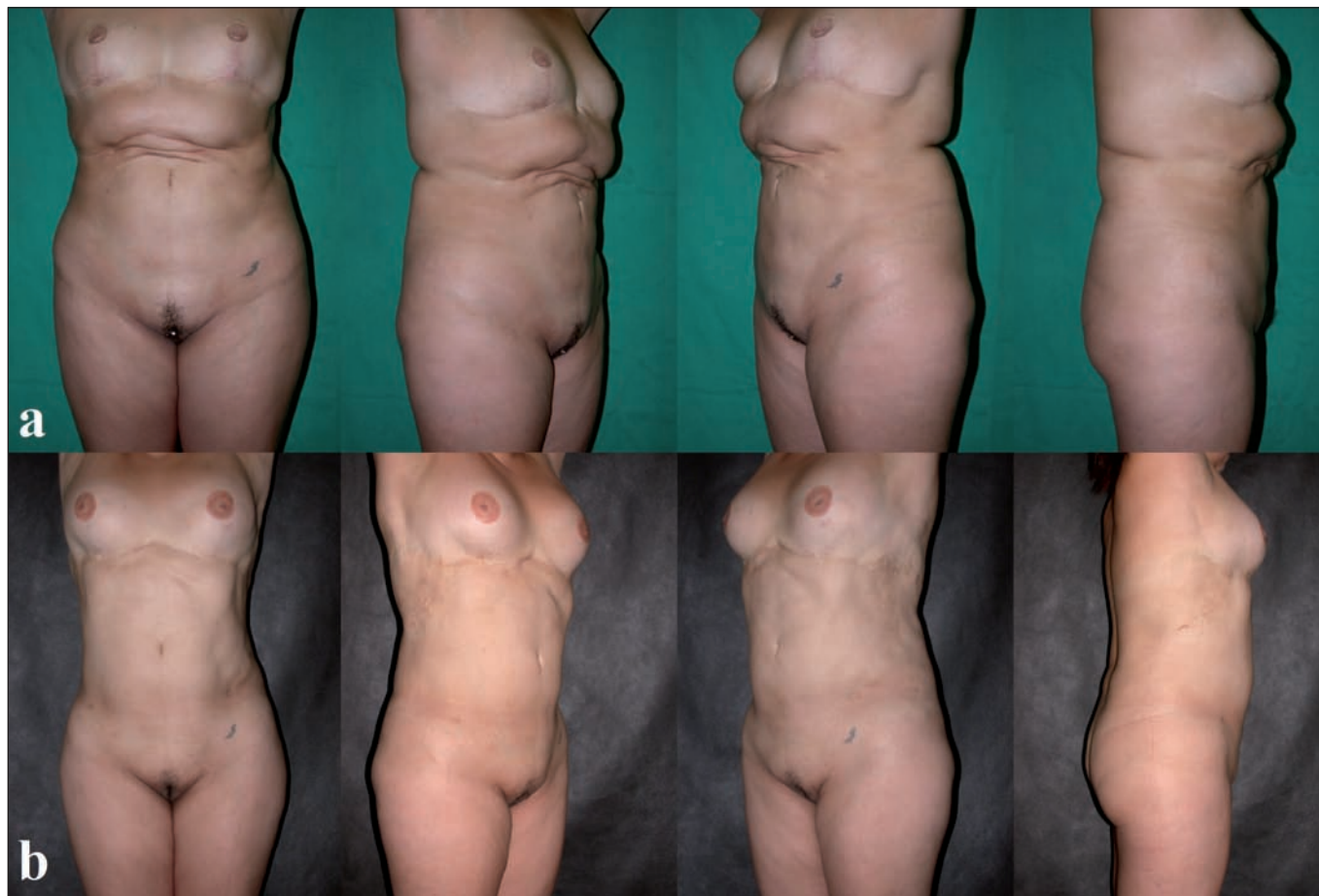
Fig. 5. Tipo III. A. Preoperatorio. B. Postoperatorio a los 8 meses.

Las clasificaciones de las deformidades abdominales publicadas anteriormente las abordan en términos de exceso de piel, depósitos de grasa y laxitud músculo-aponeurótica; (5-7) no tienen en cuenta como sus principales variables la presencia de extensas deformidades cicatriciales, depresiones o retracciones, que sin embargo son el objetivo de este trabajo, por lo cual se presenta la necesidad de categorización de estas deformidades con el fin de estandarizar su enfoque quirúrgico.