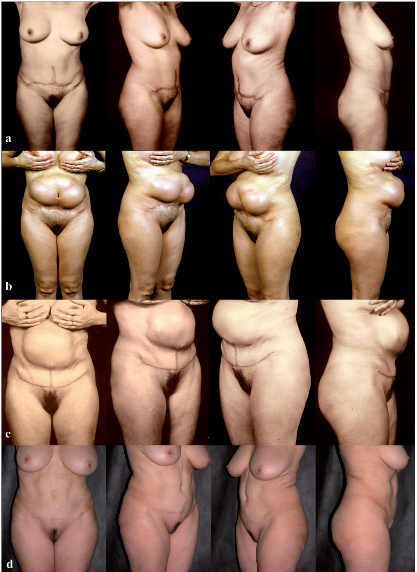
Fig. 1. Tipo I. A. Preoperatorio de la primera intervención quirúrgica. B. Postoperatorio a los 4 meses. C. Postoperatorio a los 3 meses de la segunda intervención quirúrgica. D. Postoperatorio a los 15 años de la tercera intervención quirúrgica.