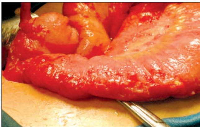
Fig. 1. Granulomatous seeding. The most severely involved organ is the terminal ileum. Siembra granular. Afectación más intensa en íleon terminal.

We report a case illustrating the difficulty of diagnosing intestinal tuberculosis, especially when it affects an immunosuppressed patient without evidence of pulmonary disease. Generally speaking, the clinical presentation and complementary tests are nonspecific; in most cases, only a histopathological examination reveals the diagnosis (Figs. 1 and 2).