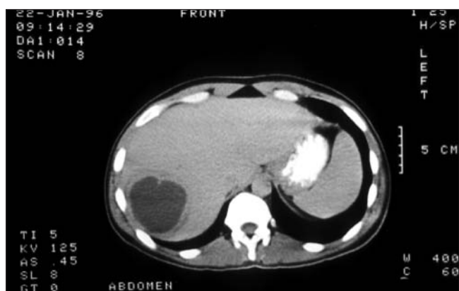
Fig. 1. Amoebic abscess. Absceso amebiano.

* Two were double and one multiple. NS: not significant.