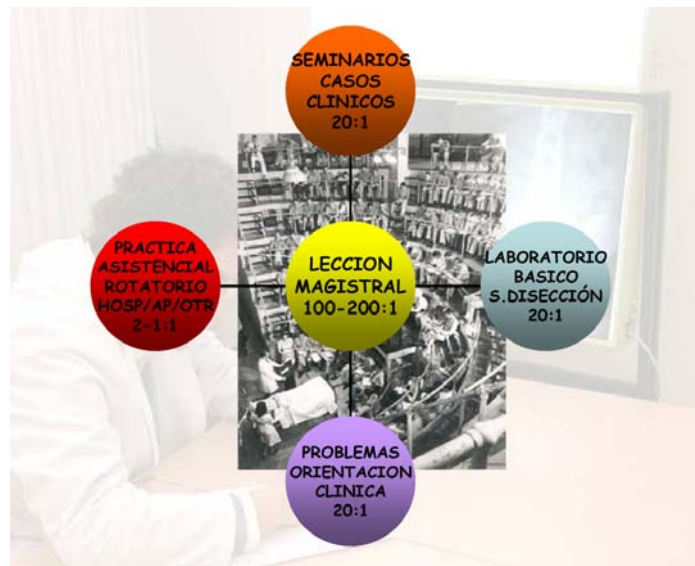
Figura 1. Diagrama en el que se muestra la configuración más frecuente del modelo formativo actual en las facultades de medicina españolas en torno a la lección magistral. Se especifican los ratios deseables en cada actividad alumno-profesor. (Los laboratorios de prácticas en disciplinas básicas –o preclínicas– como bioquímica, histología o microbiología y otras, junto a las salas de disección en anatomía, suelen estar organizados en relación con la docencia teórica. Recientemente, en algunas facultades, los departamentos básicos han introducido seminarios de problemas de orientación clínica, también basados en los contenidos teóricos de cada disciplina. En todas las facultades de medicina españolas existe formación clínica en hospitales y, en menor medida, en atención primaria u otros centros asistenciales. Los seminarios de casos clínicos no están generalizados.)

tades de medicina españolas, en el que se definen las competencias genéricas y específicas que debería tener el graduado en medicina. Los antecedentes deben buscarse en el documento elaborado por el International Institute for Medical Education. En éste se basa la Orden Ministerial ECI/332/2008.