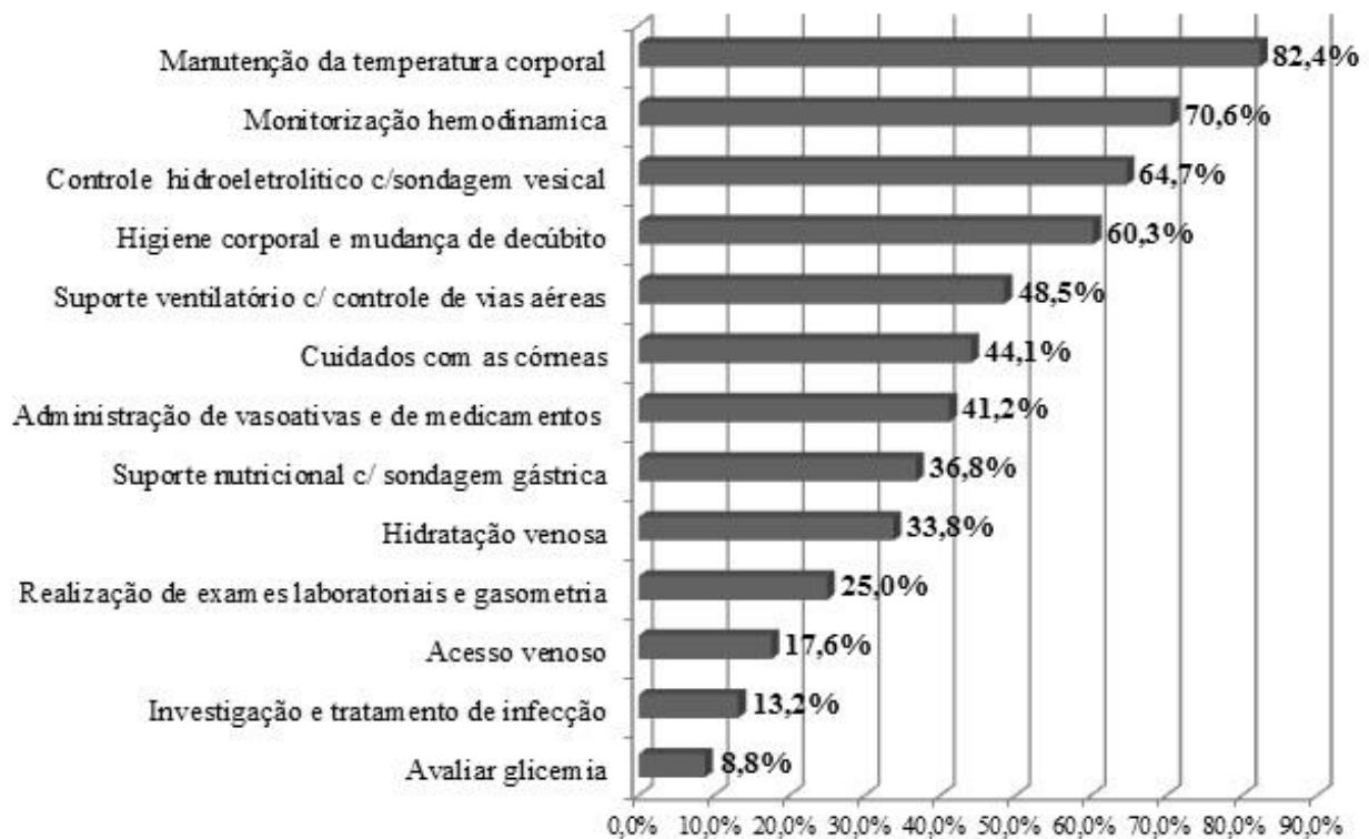
Figura 2. Descrição dos principais cuidados gerais e específicos prestados ao paciente em morte encefálica pelos profissionais de enfermagem. Natal/RN, 2013

No entanto, entre tantas respostas, algumas merecem destaque por terem sido citadas de forma equivocada, como três participantes responderam não manter a dieta, um referiu a retirada total das medicações e um deixou de responder a esta pergunta.