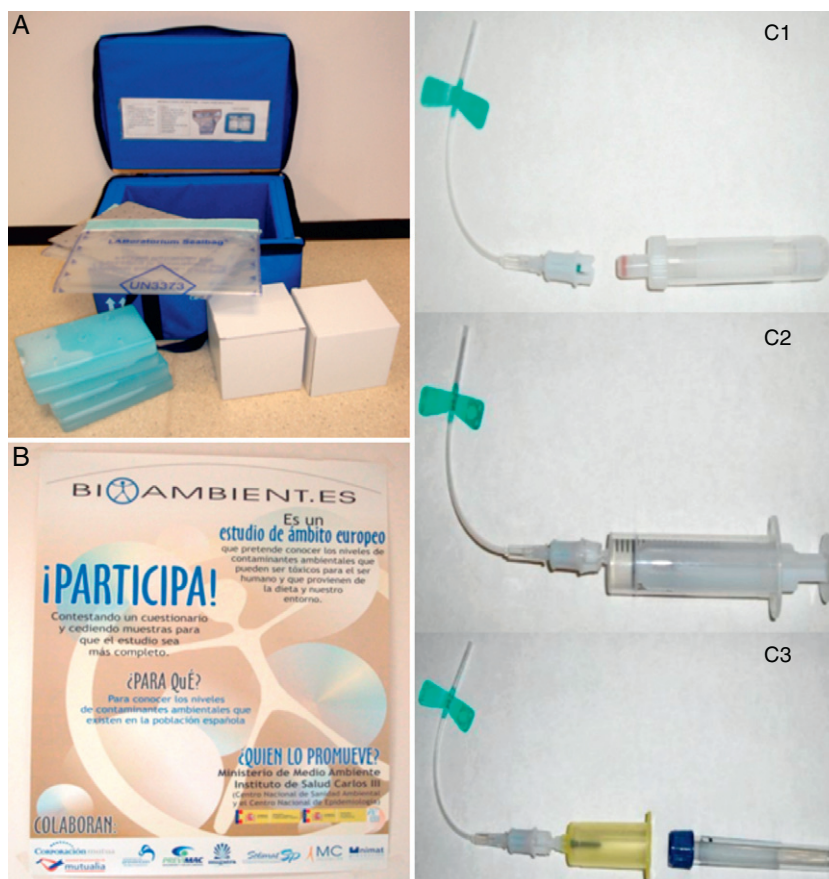
Figura 2. Estudio BIOAMBIENT.ES, 2009-2010. A) Embalaje isotérmico para el transporte de muestras. B) Póster del estudio. C1-C3) Dispositivo empleado en la extracción de muestras de sangre en función de la técnica empleada (diferentes tipos de tubos o jeringas).