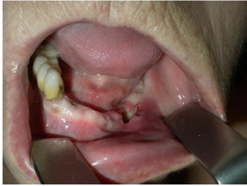
Figura 1 – Imagen de la exploración intraoral tras la retirada previa del implante.