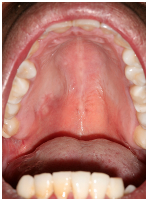
Figura 4 – Reconstrucción con colgajo de bola de Bichat derecha.