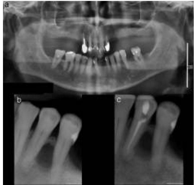
Figura 1 – a) Ortopantomografía inicial con lesión radiolúcida entre 3.4 y 3.5; b) radiografía periapical inicial; c) radiografía periapical tras tratamiento endodóncico del 3.4.

El examen radiológico muestra una lesión radiolúcida, única, ovalada de bordes bien definidos, localizada entre las raíces del 3.4 y 3.5 (fig. 1a y b). Se realiza test de vitalidad pulpar en los dientes adyacentes, siendo negativo para el 21 (3.4). Se realiza el tratamiento endodóncico de ese diente, con el