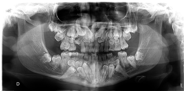
Figura 1 – Ortopantomografía.

http://dx.doi.org/10.1016/j.maxilo.2015.03.003