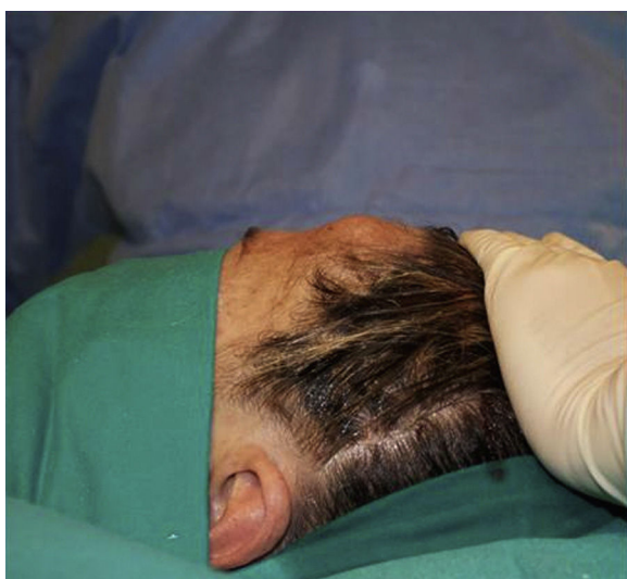
Figura 1 – Fotografía de perfil preoperatoria.

A la exploración presentaba aumento de volumen a nivel frontal izquierdo, de unos 2 cm de diámetro, indurado, asintomático, piel con características normales (fig. 1).