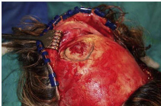
Figura 1 – Abordaje bicoronal con exposición del hemangioma.

vasculares en su interior. El tipo capilar muestra una pequeña red vascular rellena con eritrocitos y ausencia de tejido fibroso.