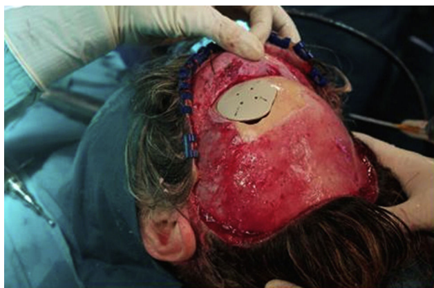
Figura 2 – Colocación de prótesis PEEK a medida del defecto.

El tratamiento de elección es quirúrgico, especialmente en aquellos casos en los que los síntomas no remiten 8 . Se debe de realizar una resección en bloque, con margen suficiente, y reconstrucción inmediata. El hecho de reseccionar la lesión con margen suficiente permite por un lado extirpar completamente la lesión y, además, reducir el riesgo de sangrado intraoperatorio 9 . En cuanto a la reconstrucción, aunque nosotros hayamos optado por una prótesis PEEK, en la literatura está descrito la reconstrucción con malla de titanio, bloques de hidroxapatita, injertos de hueso