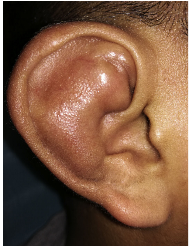
Figura 1 – Tumefacción auricular.

El tratamiento tras su llegada al servicio de urgencias consistió en drenaje del contenido mediante punción en la cara anterior del pabellón auricular derecho a nivel del antehélix con una aguja de 20 G, obteniéndose 5 cm 3 de líquido de coloración serohemática (figs. 2 y 3). Para evitar la reaccumulación del fluido se aplicó presión mecánica en la zona mediante cobertura de la misma con una mezcla de algodón y gluconato de clorhexidina al 4% (fig. 4), además de un vendaje en capelina para mantener dicha compresión. Se mandaron muestras del contenido para análisis microbiológico. El paciente fue dado de alta con antibioterapia (Augmentine ® 875/125 mg/7 días) y analgesia.