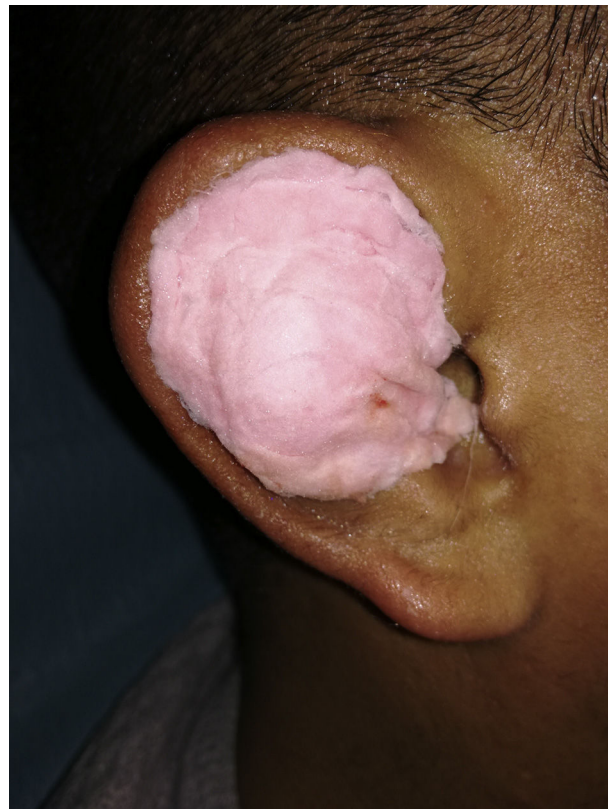
Figura 4 - Compresión aplicada para evitar recidiva.