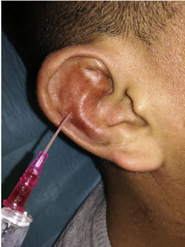
Figura 2 - Drenaje de la colección.