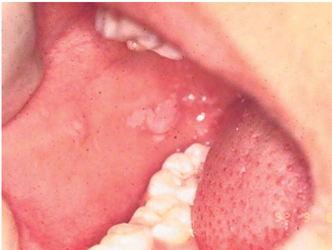
Fig. 2. Paciente con lesiones múltiples en mucosa bucal. Patient with multiple lesions in buccal mucosa.