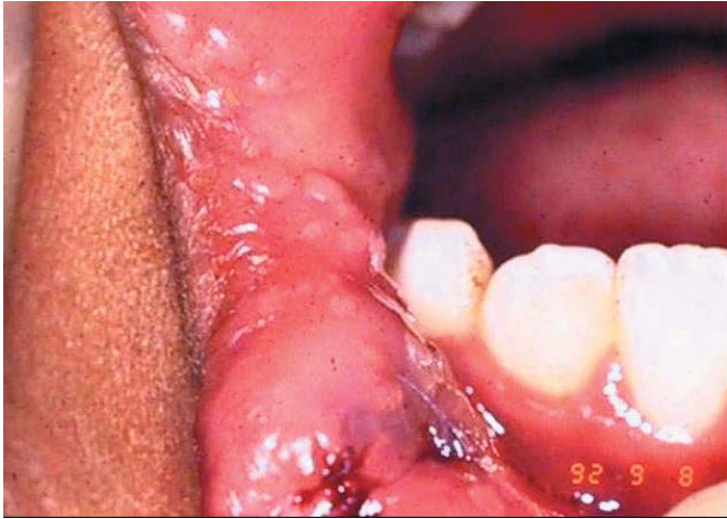
Fig. 1. Paciente con lesiones elevadas, bien delimitadas en la comisura bucal y labio inferior. Patient with elevated, well-defined lesions in commissure and lower lip.