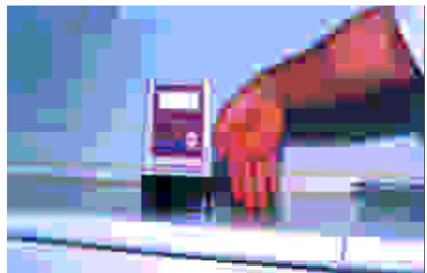
Figura 1 Bomba electrónica de infusión continua

Las zonas de elección para la inyección son 1,2,8 : el área subclavicular, tórax o abdomen. También se puede utilizar las extremidades, preferentemente a nivel proximal (Fig. 3).