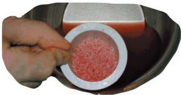
Figura 2. Filtrado del hueso particulado sobre un filtro urológico