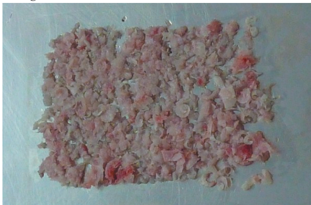
Figura 3. Plancha de hueso particulado previa a la aplicación del Tissucol.