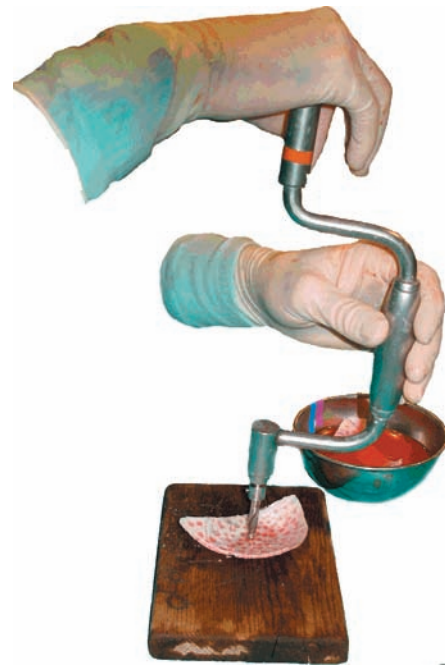
Figura 1. Observamos el berbiquí aplicado sobre el endocortex del diploe.

En el resto de la bóveda craneal, la utilizamos para dar