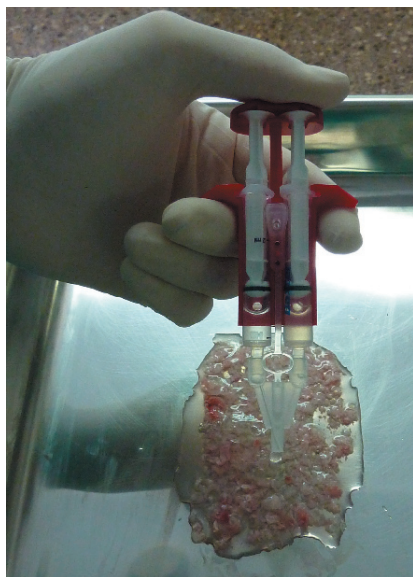
Figura 4. Aplicación de Tissucol sobre el hueso particulado.

Para la unificación del hueso y su posterior aplicación, utilizamos un adhesivo de fibrina (Tissucol®, Beriplast®...). Se filtra el hueso y, posteriormente, se extiende todo lo que sea posible sobre una superficie plana, siempre y