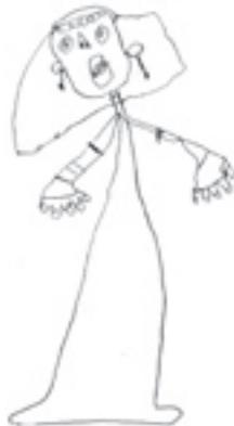
Figura 1 Dibujo de una princesa realizado por N.

En el juego, le gusta jugar a las casas, coloca y organiza los cacharros, presenta cierto grado de perfeccionismo e insistencia en el orden. Posteriormente va introduciendo al terapeuta en el juego adjudicándole el papel de la madre a la que ella cuida, prepara la comida y hace regalos, buscando siempre el reconocimiento y la gratitud y ocupar un lugar privilegiado y único para la madre. Cuida también a la hermana menor.