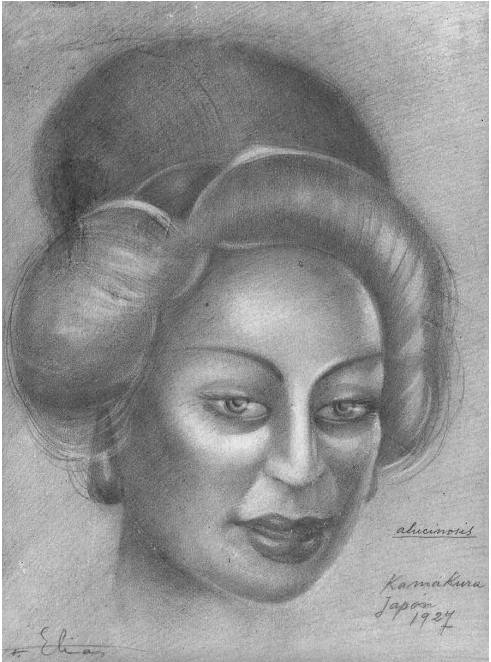
Alucinosis. Kamakura. Japón, 1927.