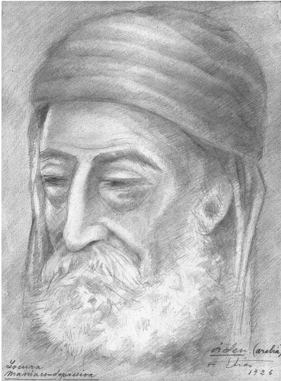
Locura Maniaco-Depresiva. Aden. Yemen, 1926.