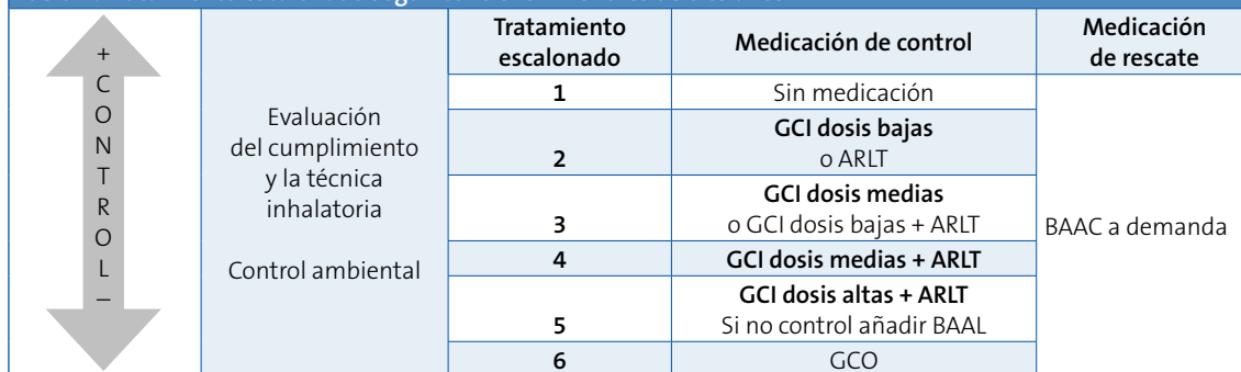
Tabla 4. Tratamiento escalonado según control en menores de tres años

En negrita el tratamiento de elección. GEMA 2009.