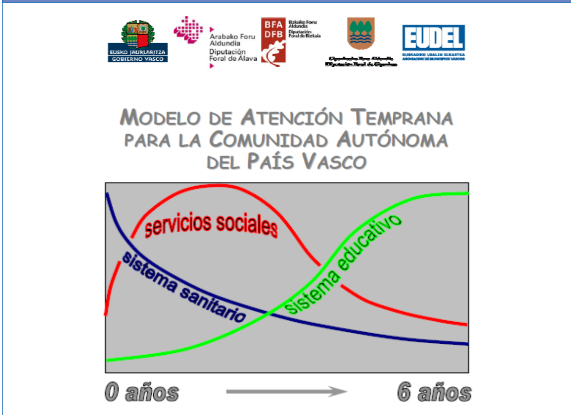
Figura 2. Modelo de atención temprana en País Vasco. Intervención secuencial de intensidad variable y coordinada entre sistemas, sanitario, social y educativo

cuatro equipos periféricos, con un total de 47 pediatras y 44 enfermeras.