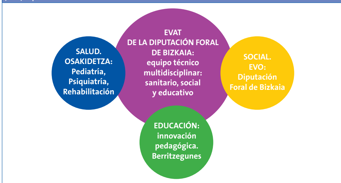
Figura 1. Conector entre sistemas. Composición del equipo técnico de valoración en atención temprana, 0 a 6 años (EVAT). Diputación Foral de Bizkaia