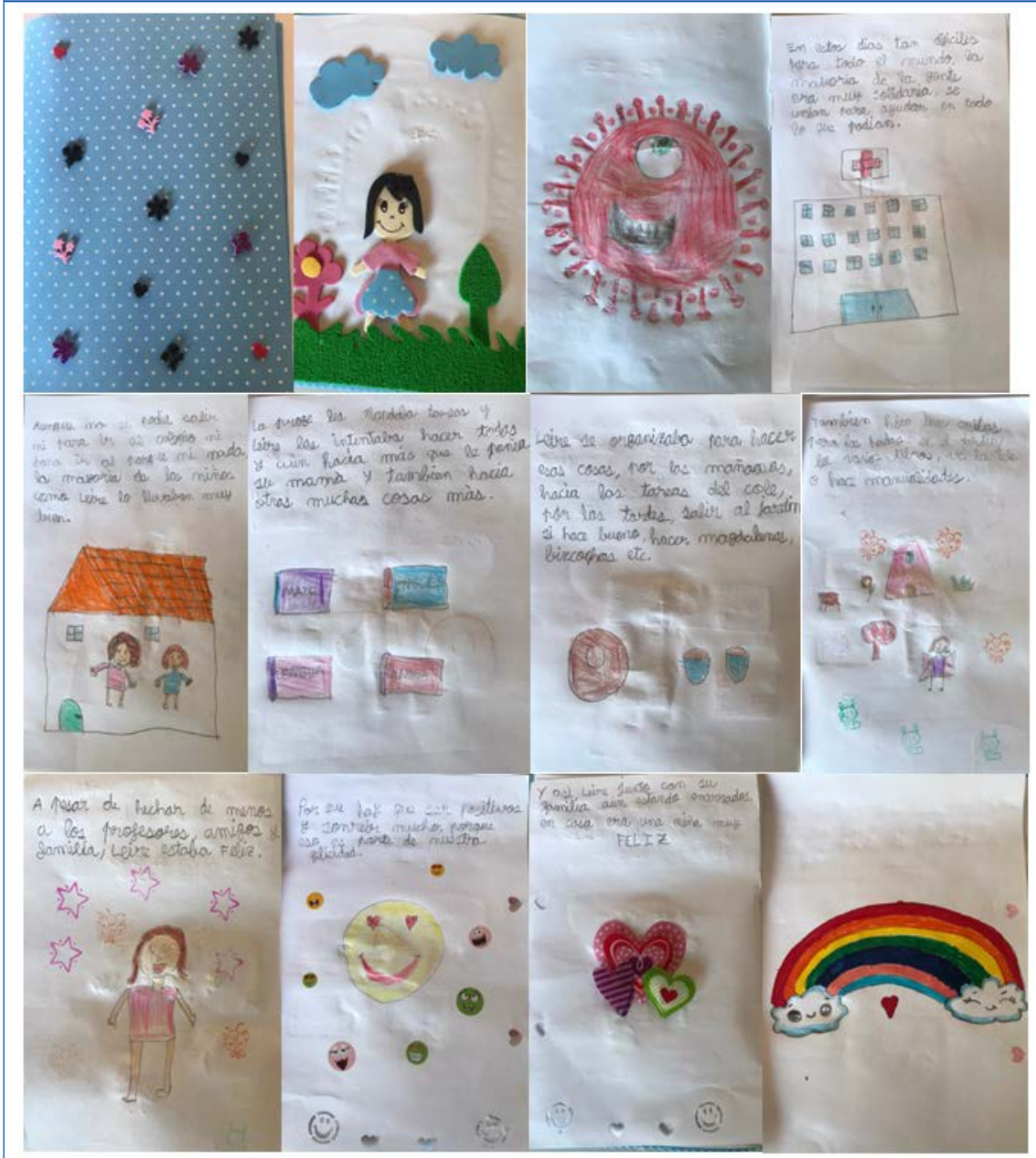
Figura 5. Cuento ilustrado premiado (Leire L., 7 años, Pontevedra)

En la Fig. 5 pueden ver y leer el cuento ganador, que recoge los contenidos anteriormente mencionados.