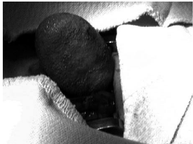
FIGURA 3. Foto en el momento de extraer el cálculo de la vejiga.

En los pacientes que desarrollan ITU los gérmenes más frecuentes son E Coli, Proteus spp y pseudomona spp. La infección por Proteus se ha asociado con cálculos de fosfato de calcio y fosfato amonio de magnesio. Los cálculos de oxalato calcio y ácido úrico son los más frecuentes. El 88% de los niños con litiasis vesical necesitan de tratamiento. El tratamiento puede ser litotricia