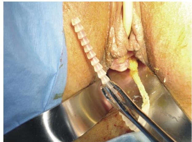
FIGURA 2. Extracción en pabellón de sistema Safyre.

Secuencia que muestra la extracción con gran facilidad de sistema Safyre, no se constata adhesión del sistema de sujeción lateral (brazos de silicona).