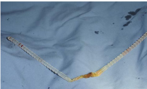
FIGURA 3. Sistema Safyre con malla multifilamento extraído. Se observa el sistema Safyre extraído completamente.

En lo referente a la facilidad con que se retiró el sistema, llama la atención la escasa adherencia que mostraba en este caso el brazo de sujeción lateral de silicona (polidimetilsiloxano). Lo que no ha sido informado por otras publicaciones con seguimientos entre 12 y 36 meses, con medias de 14 y 18 meses (5,6). Sin embargo debemos recordar que la silicona no se biointegra, por lo que la mantención de este sistema se basa en primer lugar en una sujeción otorga-