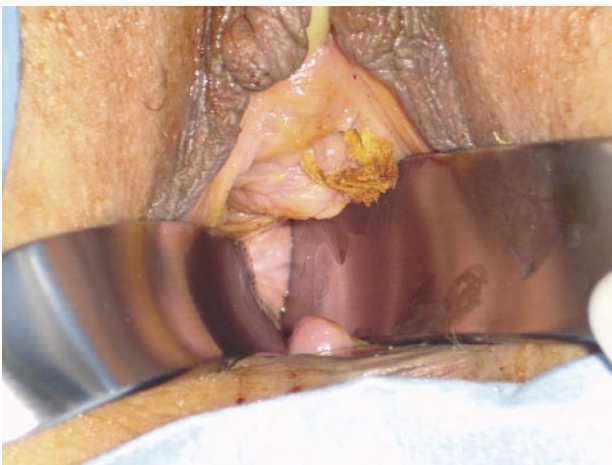
FIGURA 1A. Exteriorización de la malla en mucosa vaginal.

En la anamnesis se obtuvo la historia ya descrita y además de encontrarse con una incontinencia de orina de esfuerzo, refirió disuria. Al examen vaginal destacaba la presencia de flujo vaginal amarillo y de muy mal olor. En la mucosa vaginal de la porción suburetral se observaba la exposición de una malla de 3,5 por 1 centímetro (Figura 1). Se detectó al exa-