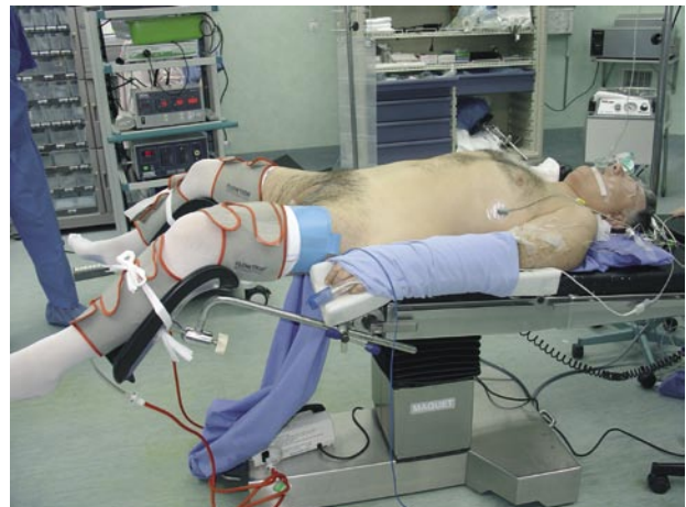
FIGURA 1. Posición del paciente.

Para la disección del ápex se realiza una apertura de la fascia endopélvica de ambos lados y se pasa un punto de Vycril® 0 para control del