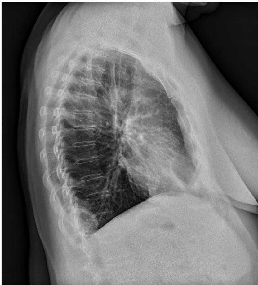
Figura 1. Radiografía de tórax en proyección lateral con imagen de hernia

Acude posteriormente a la consulta, ya prácticamente asintomática, a recoger los resultados de la prueba diagnóstica, en la cual se describe una hernia de Bochdalek derecha (Fig.1). Se le explica a la paciente el resultado de la prueba y nos ponemos en contacto con el Servicio de Cirugía General de manera telemática para comentar el caso. Tras estudiarlo y revisar las pruebas diagnósticas, dos TAC abdomino-pélvicos (Fig. 2) que llegaron a ver parte baja de tórax solicitados durante la intervención quirúrgica previa, se decide mantener en observación y en caso de presentar síntomas, remitir para estudio y tratamiento.