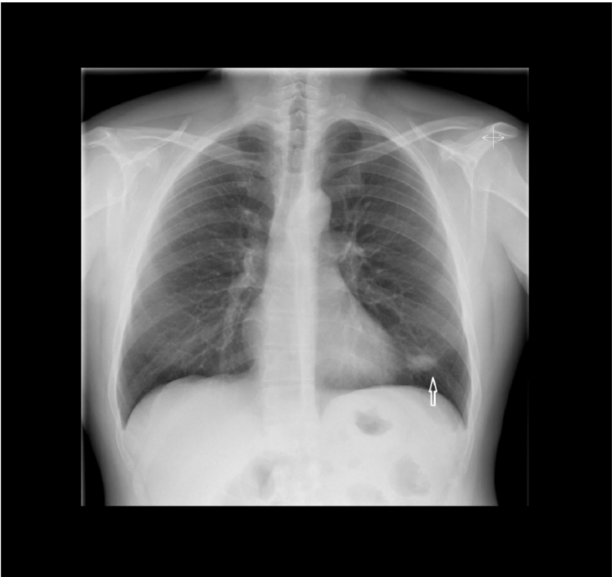
Figura 1. Radiografía de tórax. Proyección posteroanterior.

El TAC toraco-abdominal confirmó la imagen sospechosa de tromboembolismo pulmonar y puso de manifiesto múltiples adenopatías abdominales y en el área mediastínica. Fue tratado con heparina de bajo peso molecular a dosis terapéuticas y priorizaron nuestra solicitud de punción guiada por ecografía de una de las adenopatías, ante la sospecha de un síndrome paraneoplásico. El resultado de la citología fue positivo para células tumorales malignas: linfoma no Hodgkin B de células del manto.