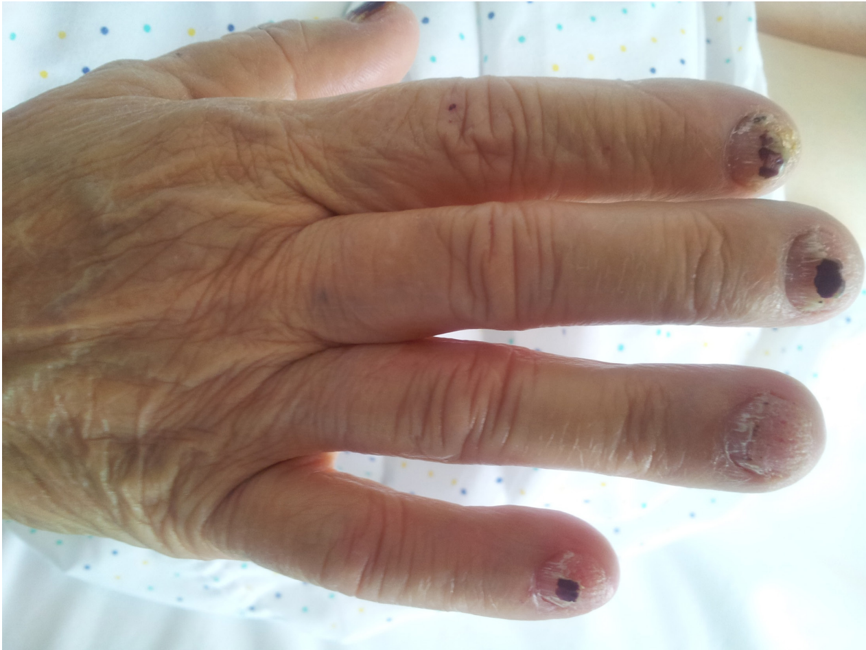
Figura 3. Destrucción de la lámina ungueal en los dedos

vitamina B12, procesos autoinmunes ( lupus-like ) y neoplasias hematológicas.