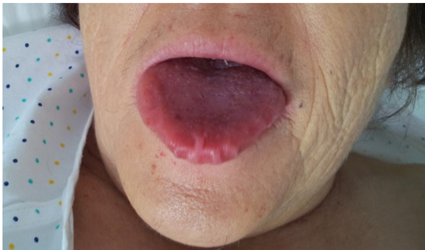
Figura 1. Macroglosia

En la exploración física destacaba un regular estado general, leve ingurgitación venosa yugular, eupneica en reposo con saturación de oxígeno del 94 % basal, afebril, macroglosia (Figura 1) y edemas maleolares leves. En la auscultación cardíaca presentaba un soplo sistólico polifocal III/VI y en la auscultación pulmonar se apreciaban crepitantes bibasales. A nivel cutáneo se detectó la presencia de hematomas periorbitarios (Figura 2) y supraclaviculares, así como la destrucción de la lámina ungueal en los dedos de ambas manos (Figura 3). La anamnesis y exploración clínica nos sugería un cuadro compatible con insuficiencia cardíaca en el cual había que valorar que fuera primaria o secundaria a endocrinopatías (hipotiroidismo), déficit de