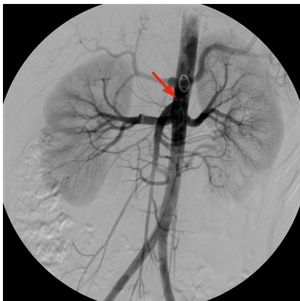
Figura 1. Aortografía abdominal y renal en las que se evidencian ambas arterias renales normales y una estenosis de la vena izquierda condicionada por una pinza aortomesentérica.

En relación con el tratamiento, este puede ser conservador o quirúrgico. El conservador está indicado en pacientes con sintomatología leve y en menores de 18 años durante 24 meses y en adultos durante 6